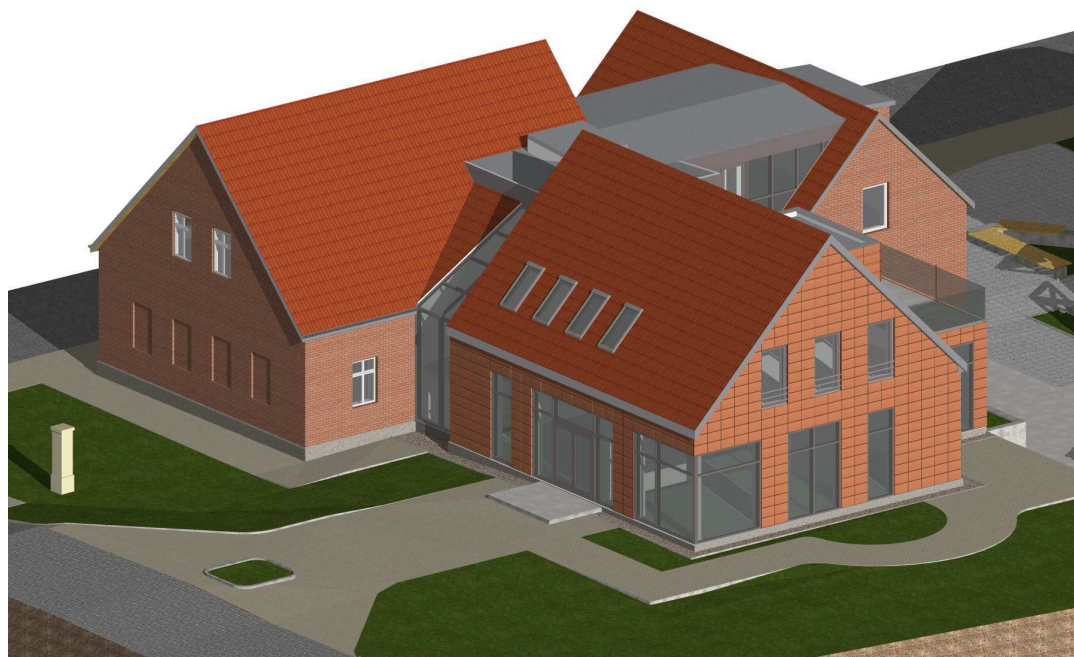
Rysunek. Wizualizacja Książnicy prof. G. Labudy w Wejherowie