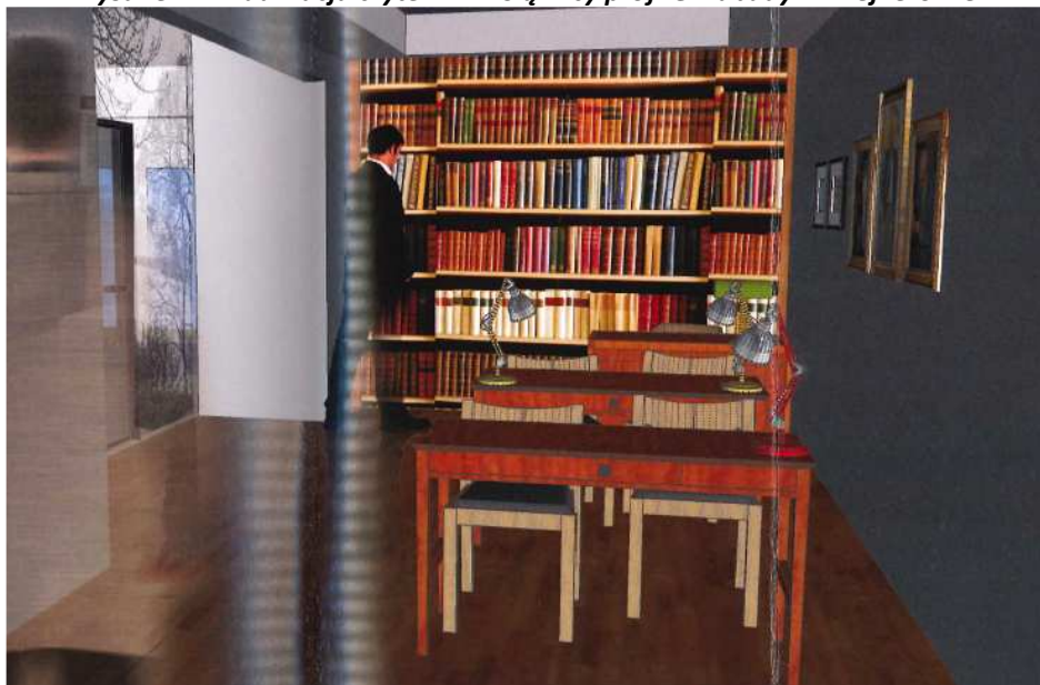
Rysunek. Wizualizacja czytelnicy w Książnicy prof. G. Labudy w Wejherowie